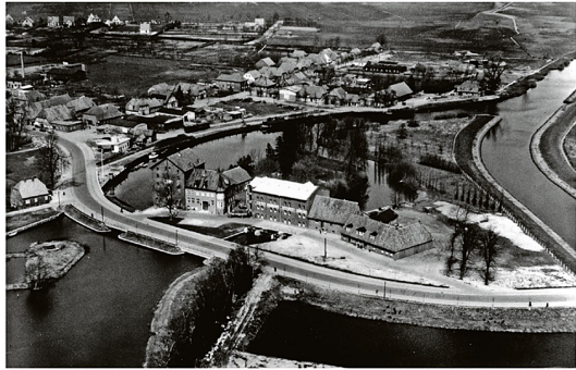
Nach Abschluss der Arbeiten: Im Mittelpunkt die Schabbelschen Mühlenwerke am Hafen und der neue Verlauf der Oste.

Im Rahmen der Osteregulierung in Bremervörde entstehen die neue Gerichtsherrnbrücke und das Ostewehr