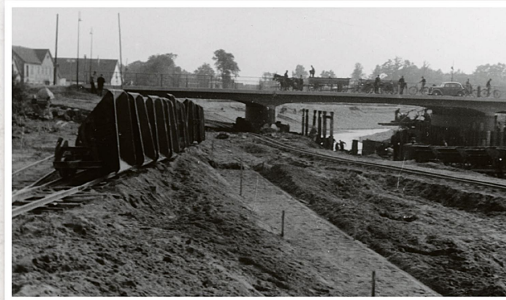
Auf der Gerichtsherrnbrücke sind Fahrzeuge und ein Pferdefuhrwerk unterwegs. Von dort hat man einen guten Blick auf die Oste-Baustelle.“