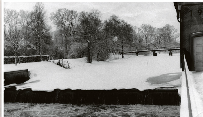
Das Ostewehr im Winter: Ob es auch weiterhin existieren oder abgerissen wird, ist derzeit in der Schwebe. Die Stadt hofft auf den Erhalt, dem Stadtbild würde ein Hingucker fehlen.