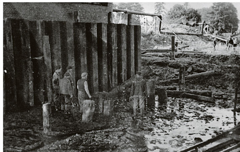
Für die Bremervörder Jungen (am rechten Bildrand) sind die Arbeiten natürlich eine Attraktion, die sie immer wieder zu der Baustelle führt.

In der heutigen „BZ-Zeitreise“ erinnern wir mit Aufnahmen an die Arbeiten und die Veränderungen im Stadtbild.