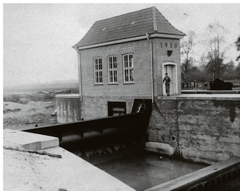
1950 wird, wie die Jahreszahl zeigt, mit dem Bau des Ostewehrs begonnen. Ein Gebäude, das heute noch die Oste in diesem Bereich prägt.