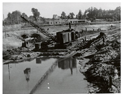
Das neue Ostebett entsteht.