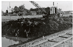
Zwei Millionen Mark – für damalige Verhältnisse eine ungemein hohe Summe – kostet die sogenannte „Osteregulierung“ den Staat.