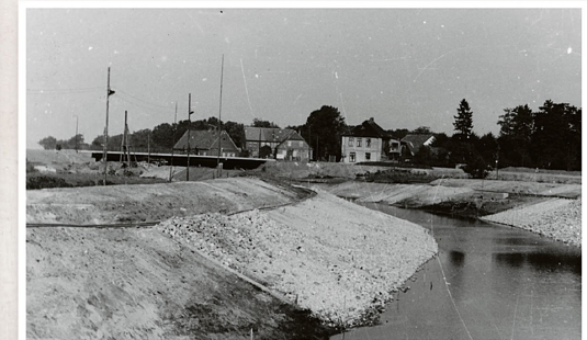
Von der Baustelle aus geht der Blick auf die Kreuzung der Neuen Straße mit der Stader Straße.