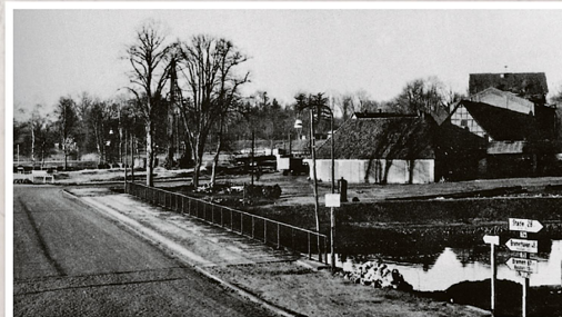
1952 ist die neue Gerichtsherrnbrücke fertig. Sie führt über den im Zuge der Osteregulierung ausgebauten Nebenarm der Oste. Im Hintergrund stehen die Schabbelschen Mühlenwerke mit Nebengebäuden.