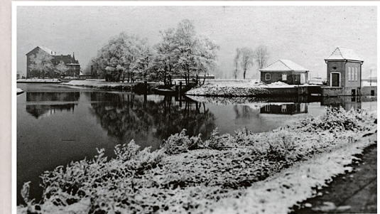
Das Ostewehr (rechts) und die Schabbelschen Mühlenwerke (links) in einem Winter in den 1950er Jahren.