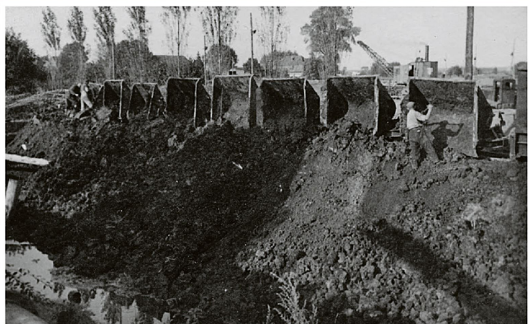
Im Rahmen der sogenannten „Notstandsarbeiten“ wird ein großer Teil der notwendigen Arbeitskräfte vom Bremervörder Arbeitsamt ausgewählt und abgestellt.