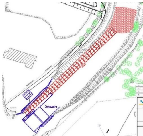
Sohlgleite im Bereich der Schleuse