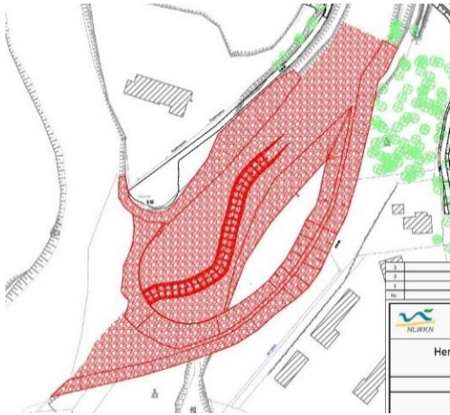
Sohlgleite im Hauptstrom